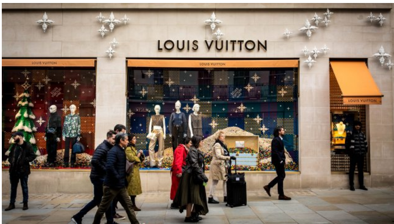
Een winkel van Louis Vuitton in Londen.